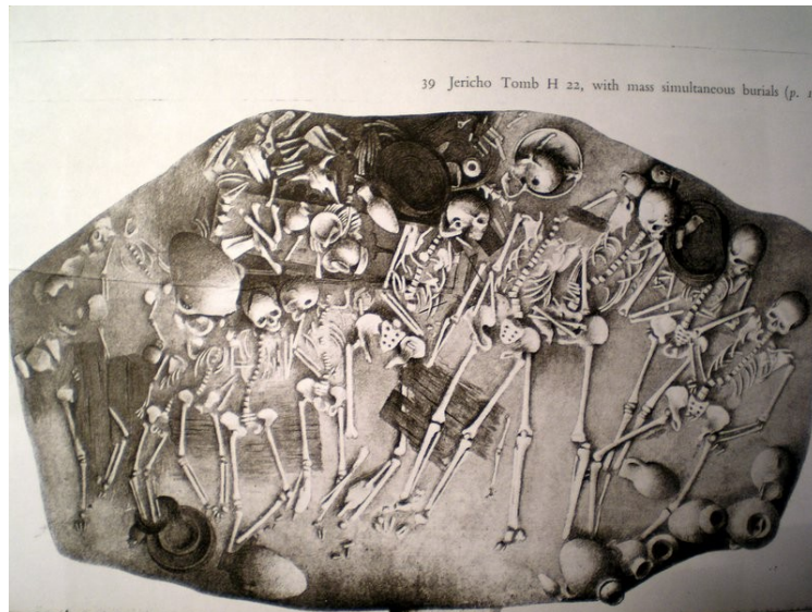
Jerikó „H 22” tömegsír

élelem maradványaival, fatárolók, fegyverek, különféle szerszámok, ékszerek és pecsétek.) Szokatlan jelenség a jerikói sírok esetében, hogy a szerves anyagok részben megmaradtak, különösen a fából készült bútorok és szerszámok, amely alapján jól rekonstruálható a korabeli bútorzat, viselet és táplálkozási szokások.