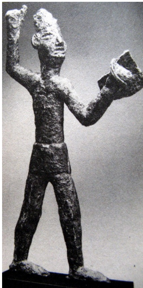
Megiddó, bronz Baál, (Hadad) szobor